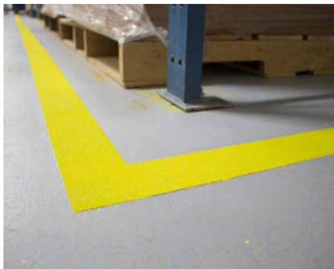
Применение в качестве прозрачного слоя поверх Belzona 5231 с наполнителем

Для получения дополнительной информации обратитесь к представителю Belzona в своем регионе: