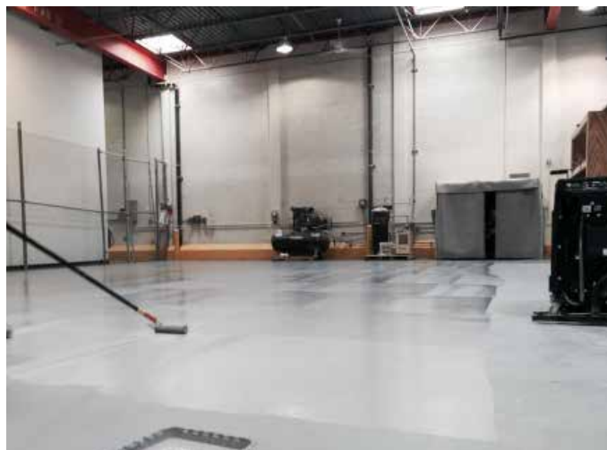
Belzona 5233 легко наносится вручную с помощью кисти или валика

Система не содержит растворителей, легко смешивается и наносится валиком, при этом для отверждения не требуется горячая обработка.