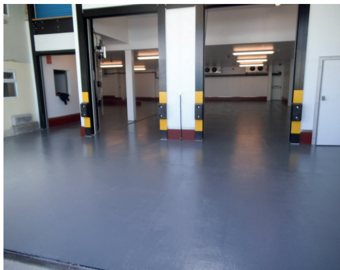
Полы на складе молочного завода восстановлены с помощью Belzona 5231

Система не содержит растворителей, легко смешивается и наносится валиком, при этом не нужны ни горячая обработка, ни специальные инструменты.