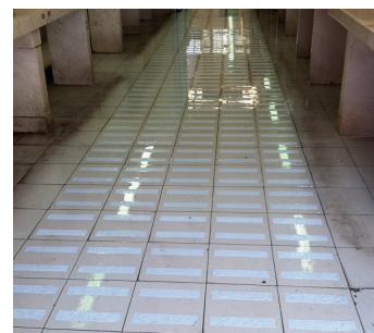
Плиточный пол с нанесенным покрытием

Для получения дополнительной информации обратитесь к представителю Belzona в своем регионе: