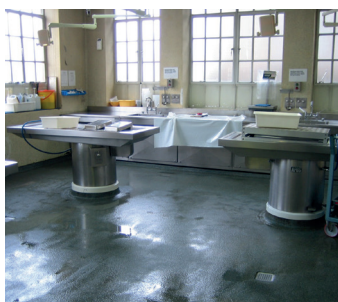
Бетонный пол до ремонта