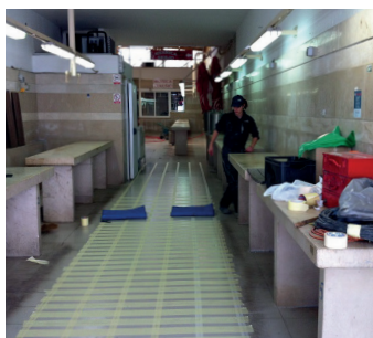
Первоначальное состояние плиточного пола