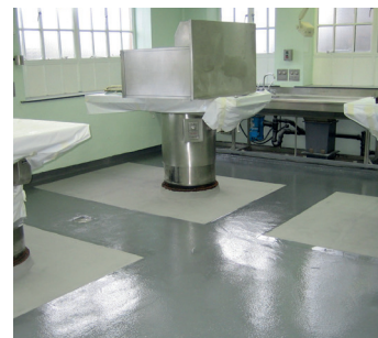
Бетонный пол после ремонта