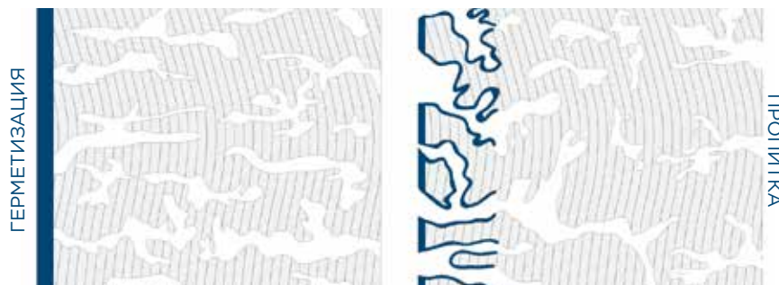
Разница между герметизацией и пропиткой

При нанесении на кирпичную/каменную кладку или бетон Belzona 5122 не изолирует поверхность от внешней среды, а пропитывает наружный слой подложки. Образующееся при этом покрытие не только превосходно защищает подложку от влаги, но и позволяет ей «дышать».