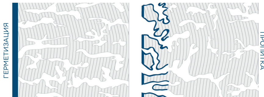
Разница между герметизацией и пропиткой

При нанесении на кирпичную/каменную кладку или бетон Belzona 5122 не изолирует поверхность от внешней среды, а пропитывает наружный слой подложки. Образующееся при этом покрытие не только превосходно защищает подложку от влаги, но и позволяет ей «дышать».