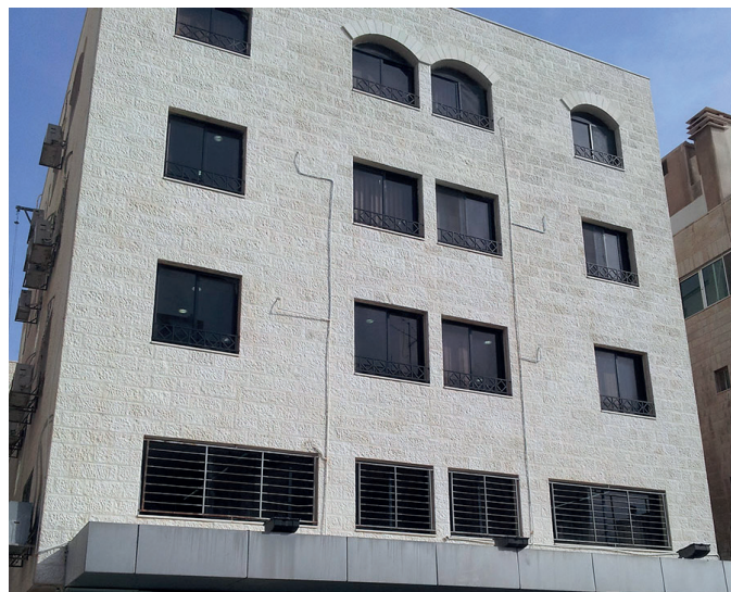
Невидимое покрытие защищает весь фасад гостиницы

Belzona 5122 не дает загрязнениям скапливаться на поверхности и препятствует росту плесени, мхов и лишайников.