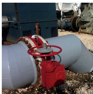
Труба после нанесения покрытия