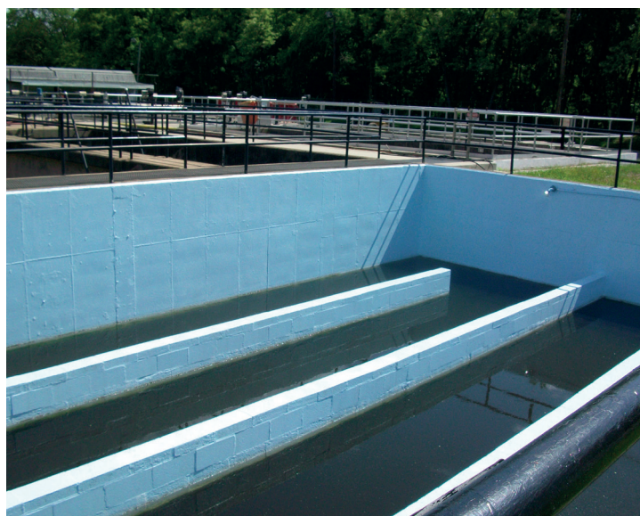
Стенки резервуара для хлорирования защищены с помощью Belzona 5111

Благодаря водонепроницаемости и химической стойкости поверхности покрытие легко очищается с помощью обычных мощных средств.