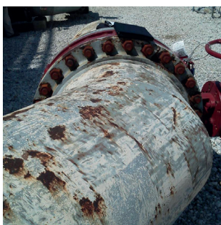
Труба до ремонта