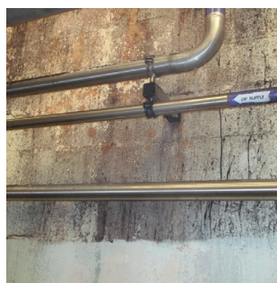
Первоначальное состояние стены