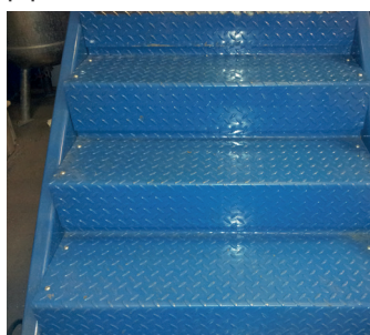
Первоначальный вид металлической лестницы