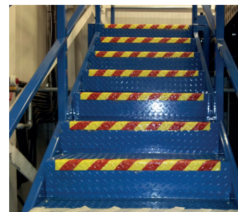
Металлическая лестница после ремонта