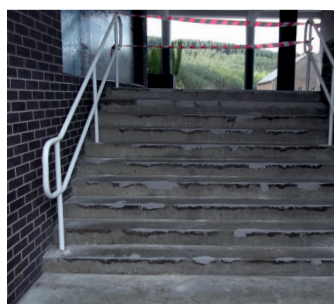
Бетонная лестница до ремонта