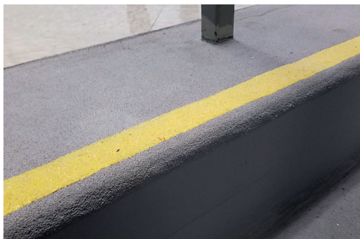
Состояние покрытия Belzona 4411 после эксплуатации более года