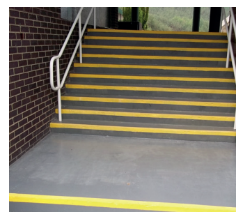
Вид бетонной лестницы после ремонта

Для получения дополнительной информации обратитесь к представителю Belzona в своем регионе: