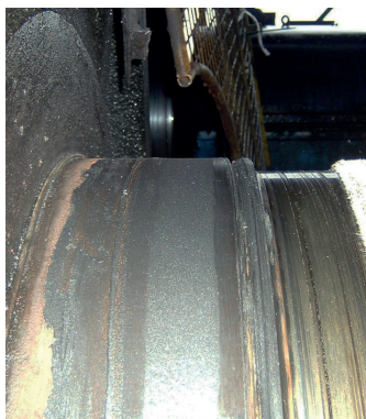
Уплотнительная поверхность после ремонта