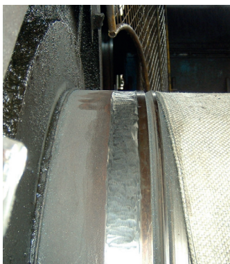
Износ участка уплотнения