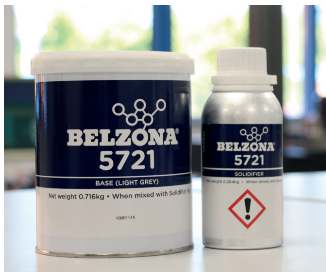
Объем упаковки Belzona 5721 оптимизирован для ремонта на месте.

Для получения дополнительной информации обратитесь к представителю Belzona в своем регионе: