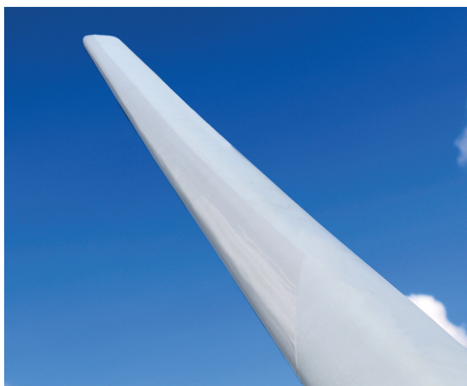
Belzona 5721 выпускается в двух цветовых вариантах — белого и светло-серого цвета (RAL 7035)

Подходит для другого оборудования этого типа, в частности, для защиты лопастей вентиляторов.